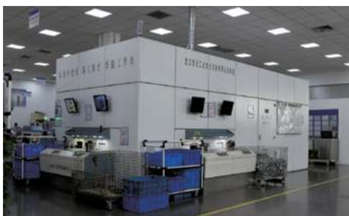
Роботизированная рабочая станция для лазерной сварки