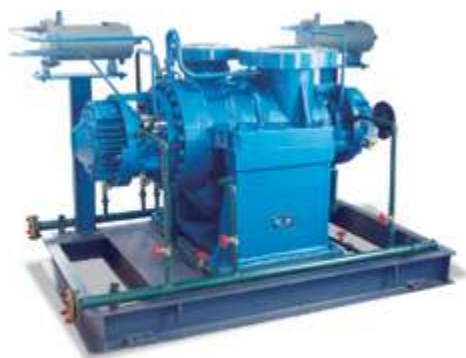
NKY Насос для тяжелых условий эксплуатации