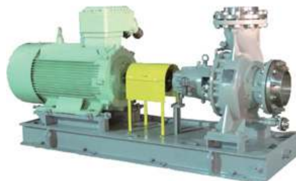
KCZ Насос для химических процессов

Мембранный насос высокого давления для опреснения морской воды и бустерный насос высокого давления с суточной производительностью 5 000 – 12 500 тонн стабильны и надежны в работе. Получен заказ на 10 000 насосов высокого давления для опреснения морской воды на электростанции Датан Хуандао.